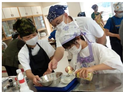
親子で調理実習に取り組む

7月6日（土）の参観日には多くの保護者の皆様が来校してくださり、子どもとともに活動したり学んだりしていただきました。