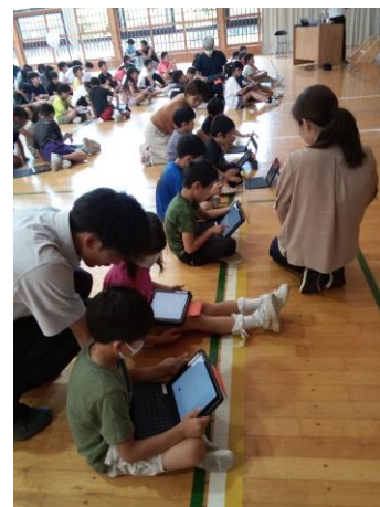
その場でアンケート

授業参観では、学校での学びの様子を見ていただくとともに、親子で一緒に授業に取り組んでいただいた学年もあり、子どもたちにとっても貴重な経験となりました。