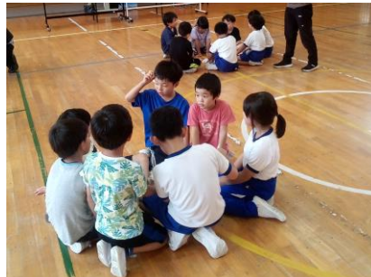
どうすればいいのかな？