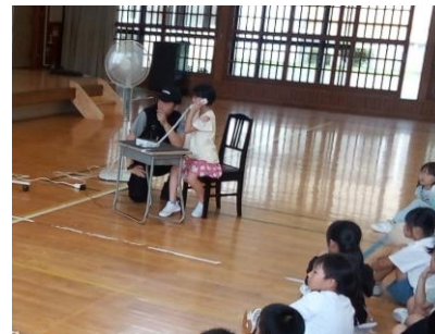
怪しい電話がかかってきたら…

また17日には「防犯教室」が行われ、「登下校時に車に連れ込まれそうになったら」「留守番のときに不審な電話がかかってきたら」など、リアルな状況を設置して、安全な対応を教えていただきました。実際にやってみたり、グループで意見を出し合ったりして、ただ聞くだけでは得られない学びとなりました。