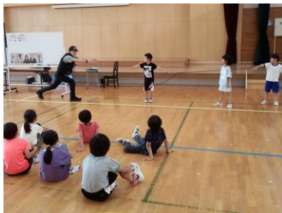
怖い人につかまらないように…

7月1日には「水難防止教室」が行われ、夏になると接する機会が多くなる水辺での事故防止について、全校で学びました。海や川遊びなど、気を付けて安全に楽しみたいですね。