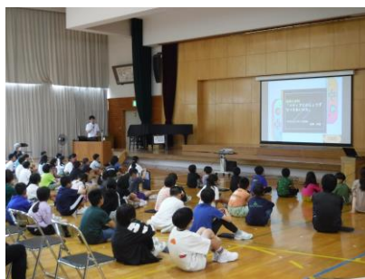
親子でメディアについて考える